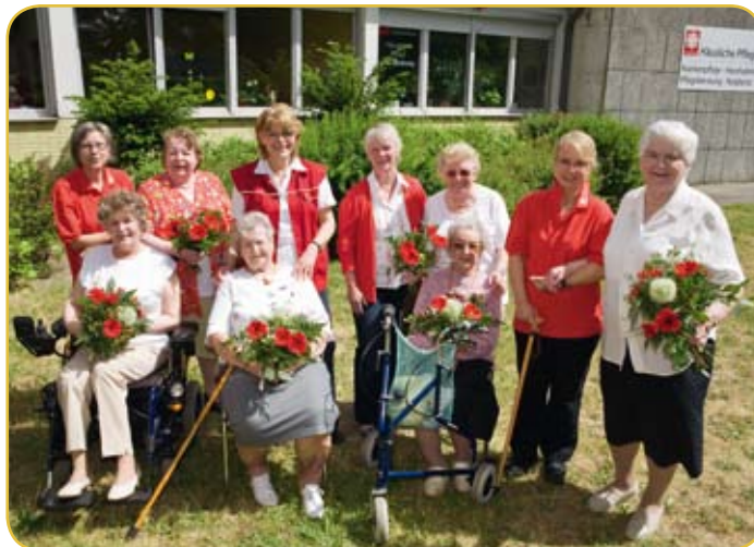
Konzept und Design: kakoi Berlin | Fotos: Matthias Lindner; dreamstime